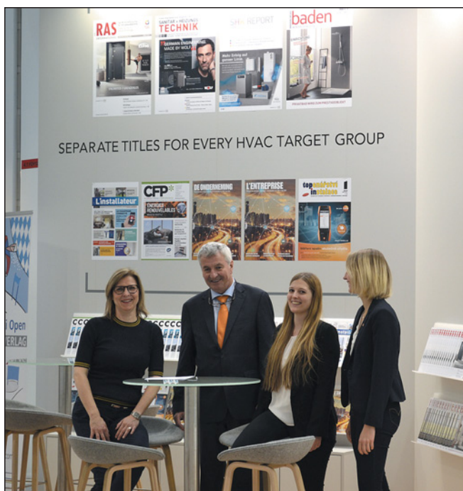
ISH 2019 – časopis Topenářství instalace na stánku odborných periodik vydavatelství Krammer Verlag

Od 11. do 15. března se přibližně 190 000 návštěvníků ze 161 zemí vydalo na veletržní a výstavní centrum ve Frankfurtu nad Mohanem s cílem poznat nejnovější inovace a trendy v oboru TZB. Po dobu pěti dnů své produkty a technologie prezentovalo na 2532 vystavovatelů z 57 zemí, z toho mnozí z nich v celosvětové premiéře. Výrazně vyšší míra mezinárodního zastoupení oproti poslednímu ročníku potvrdila, že ISH nadále posiluje svůj význam na poli světové konkurence: 66 % vystavovatelů a téměř 48 % návštěvníků dorazilo ze zahraničí.