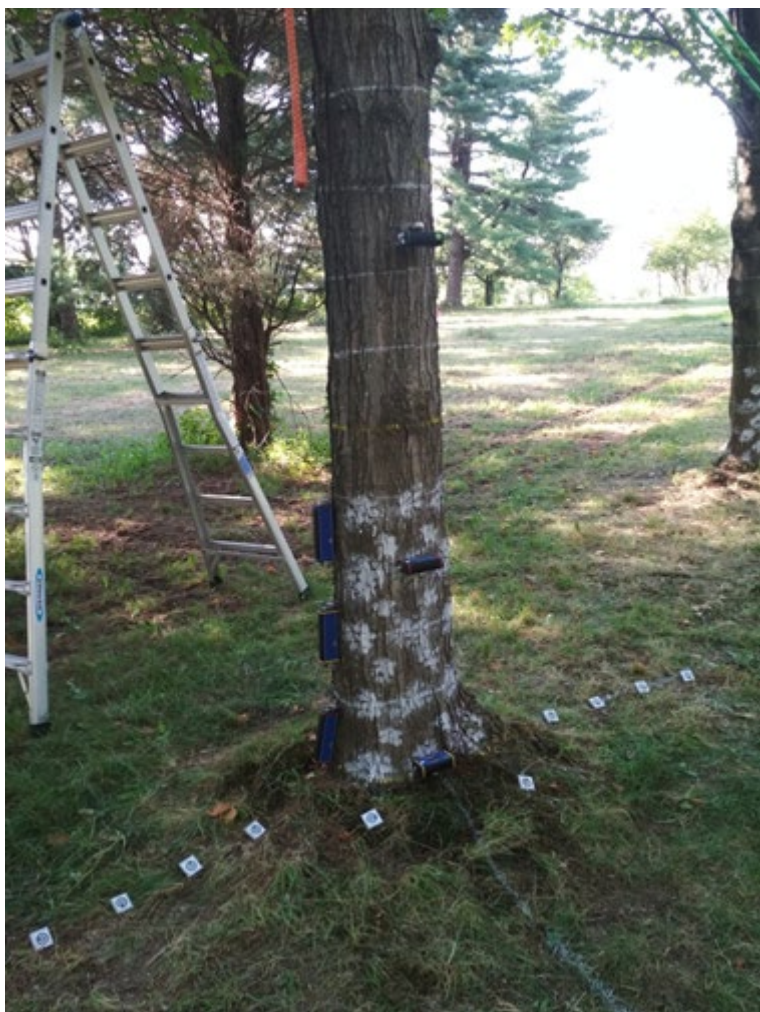
Srovnávací měření na výzkumné ploše arboristické společnosti Davey (Ohio 2019)